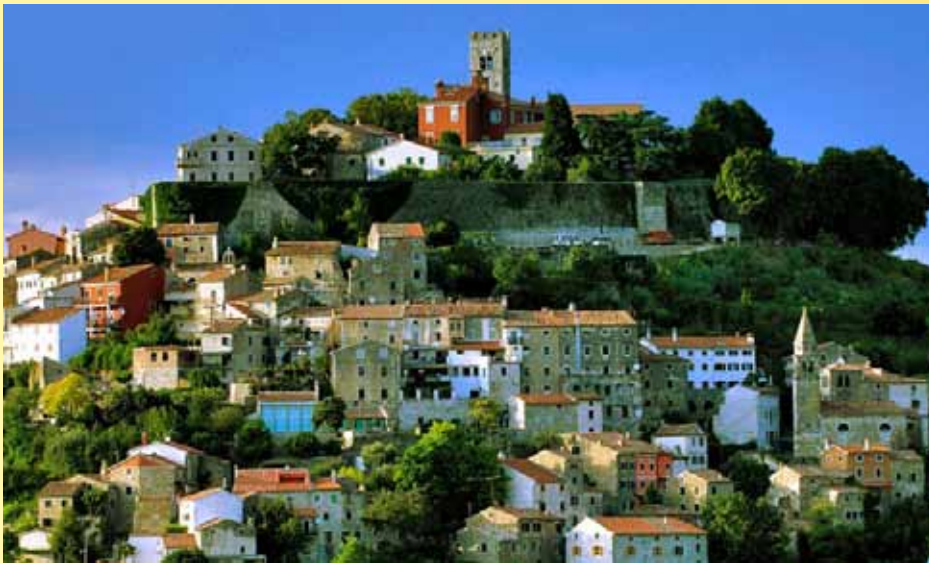
I middelalderbyen Motovun får du mulighed for at smage trøfler!