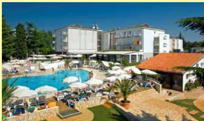
6 nætter på Hotel Pinia med All Inclusive og flotte faciliteter!