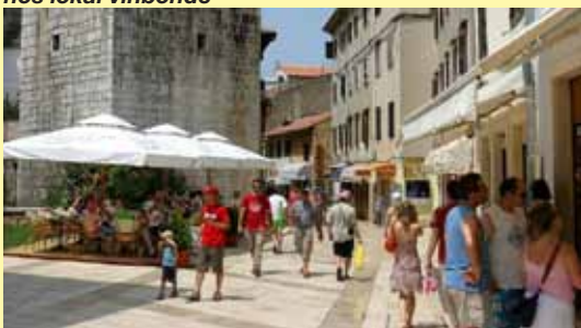
Du vil hurtigt føle dig hjemme i Porec, der byder på listige stræder, butikker og en hyggelig havnepromenade!