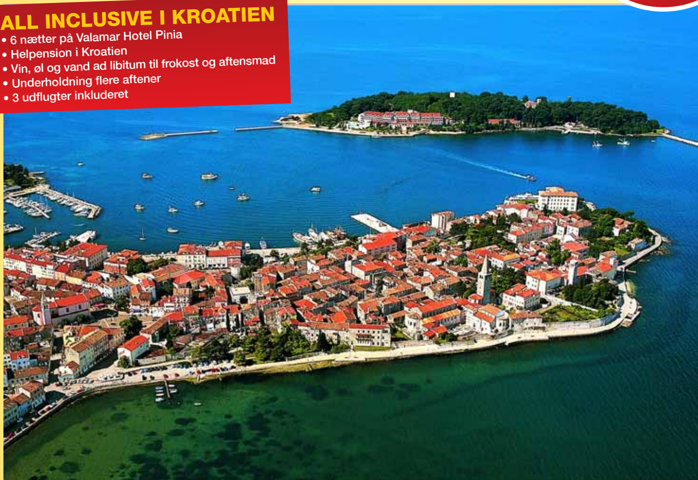
Du bor i gåafstand til venezianske Porec – en af Istriens mest populære byer!