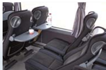
Komfortable flysæder og nakkestøtte!

Bus er en optimal rejseform, når De ønsker oplevelser fra start til slut. De når at få både hjertet og sjælen med på ferie, når De fra Deres behagelige sæde oplever de smukke landskaber. Fælles samvær og rejselederens informationer er også en vigtig del af en god busrejse. Gislevs busrejser køres i et behageligt tempo med passende pauser undervejs.